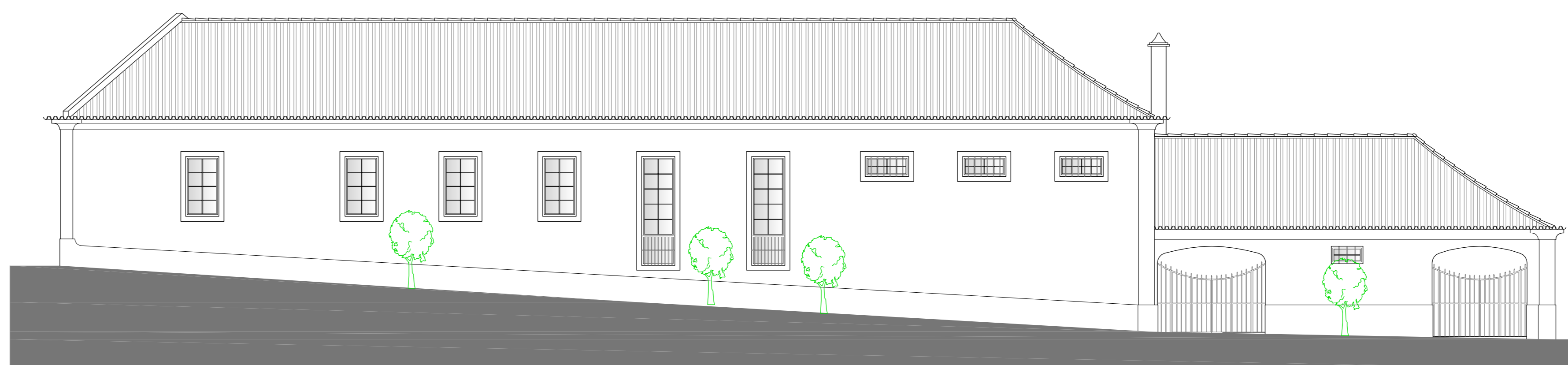
ALÇADO LATERAL DIREITO