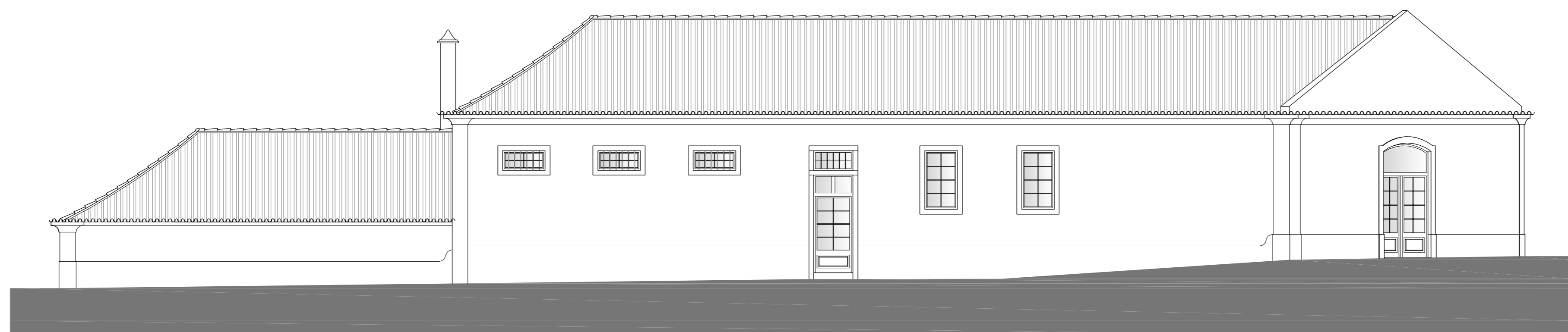
ALÇADO LATERAL ESQUERDO