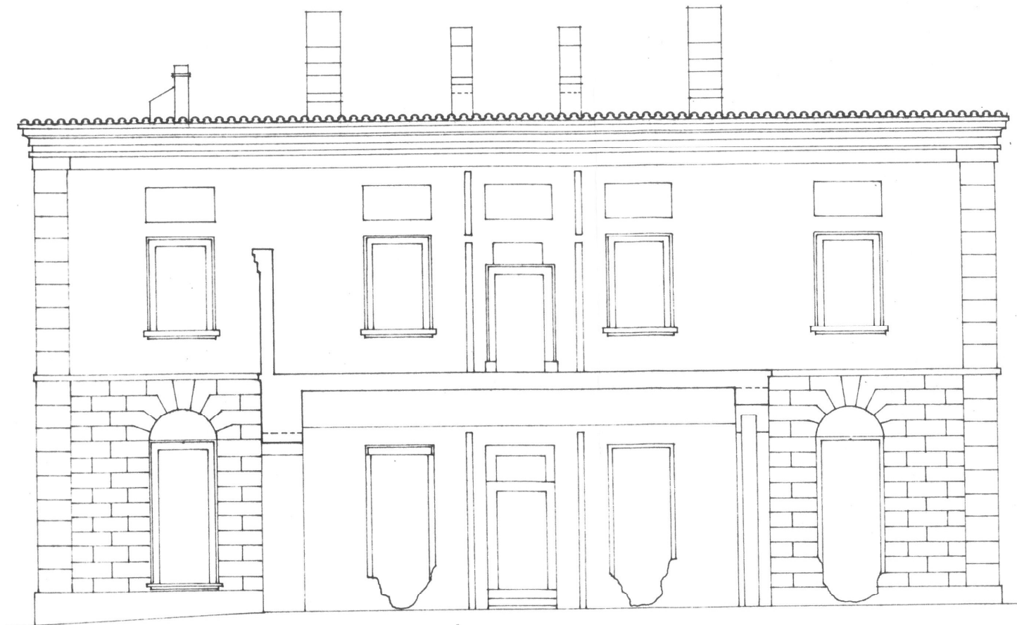
ALÇADO NORTE /CORTE EDIF. PRINCIPAL