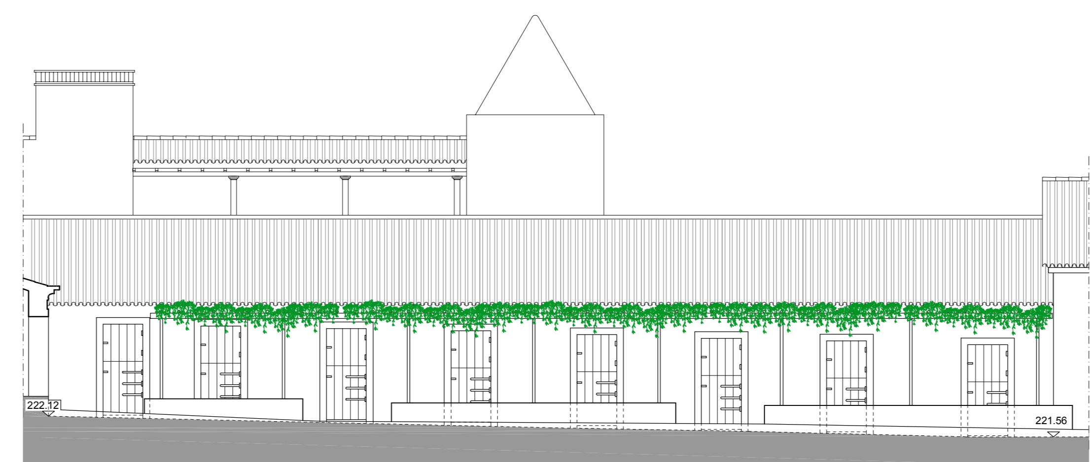
CORTE D.D / ALÇADO DAS BOXES

PROJETISTA: DOUTOR PEDRO DE ALMEIDA, M.º A.C. ENGENHEIRO PEDRO DE ALMEIDA PEDRO DE ALMEIDA, M.º A.C. entre planos Lda. em funcionamento Rua da Restauração, 108 1050-108 Lisboa, Portugal Telefone: +351 21 500 00 00 www.entreplanos.com WWW.ENTREPLANOS.COM