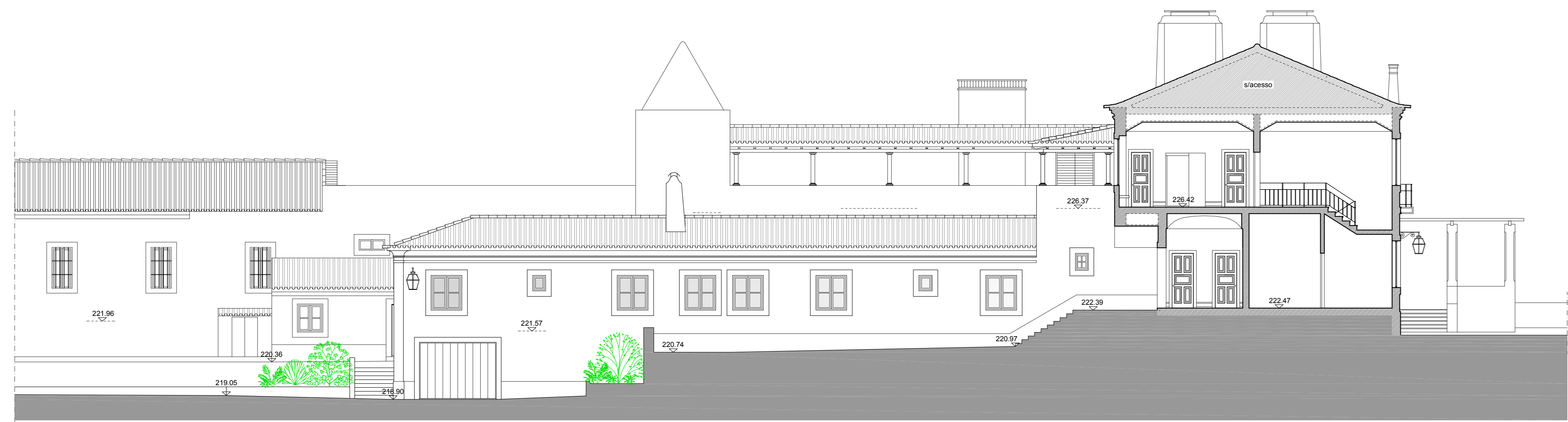
CORTE B.B / ALÇADO LATERAL ESQUERDO